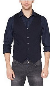
S.OLIVER s.Oliver Anzug-Weste € 59,99