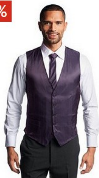
STUDIO COLETTI Studio Coletti Kurzweste (2 Stück) € 54,99 ab € 18,99