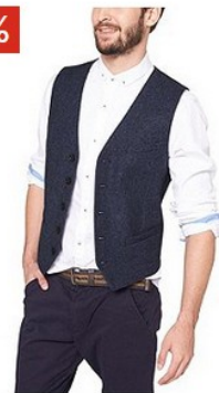
S.OLIVER s.Oliver Anzug-Weste € 69,99 € 55,99

Achtung: Gerade nicht ausreichend ist es, erst dann über das Thema Versandkosten zu informieren, wenn der Letztverbraucher den Bestellvorgang durch Einlegen der Ware in den virtuellen Warenkorb schon eingeleitet hat. Keine Rolle spielt hierbei, ob Versandkosten anfallen oder nicht.