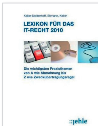
Keller-Stoltenhoff/Ehmann/Keller: Lexikon für das IT-Recht 2010

Derzeit 20 E-Books zu aktuellen Rechtsthemen, insbesondere aus dem Bereich des Rechts der Informationstechnologie, des E-Commerce und des Vergaberechts. Die E-Books stehen zum kostenlosen Download bereit.