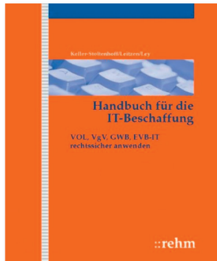
Keller-Stoltenhoff/Leitzen/Ley: Handbuch für die IT-Beschaffung