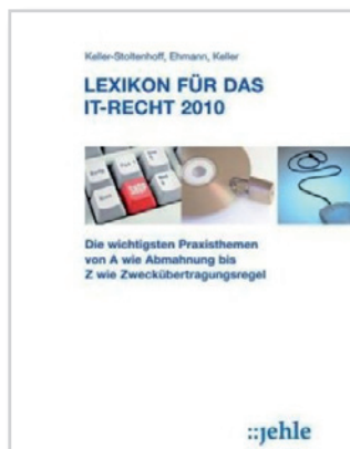
Keller-Stoltenhoff/Ehmann/Keller: Lexikon für das IT-Recht 2010

Derzeit 20 E-Books zu aktuellen Rechtsthemen, insbesondere aus dem Bereich des Rechts der Informationstechnologie, des E-Commerce und des Vergaberichts. Die E-Books stehen zum kostenlosen Download bereit.