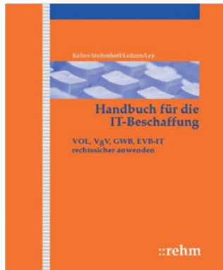
Keller-Stoltenhoff/Leitzen/Ley: Handbuch für die IT-Beschaffung